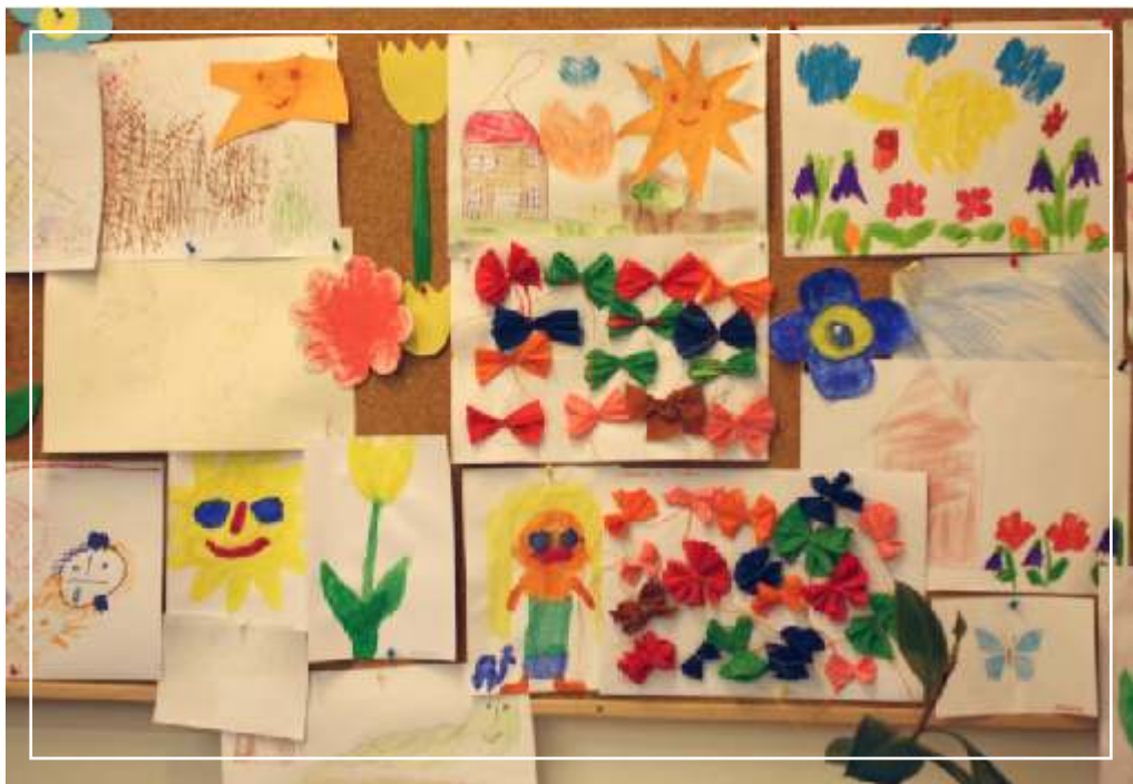
Tvorba našich klient